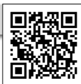
(お問い合わせ窓口)

ご相談は担当部署までお問い合わせください。お電話のほかに、24時間受付可能なWeb相談フォームもご利用ください。