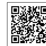
保証料の試算はこちらをご確認ください