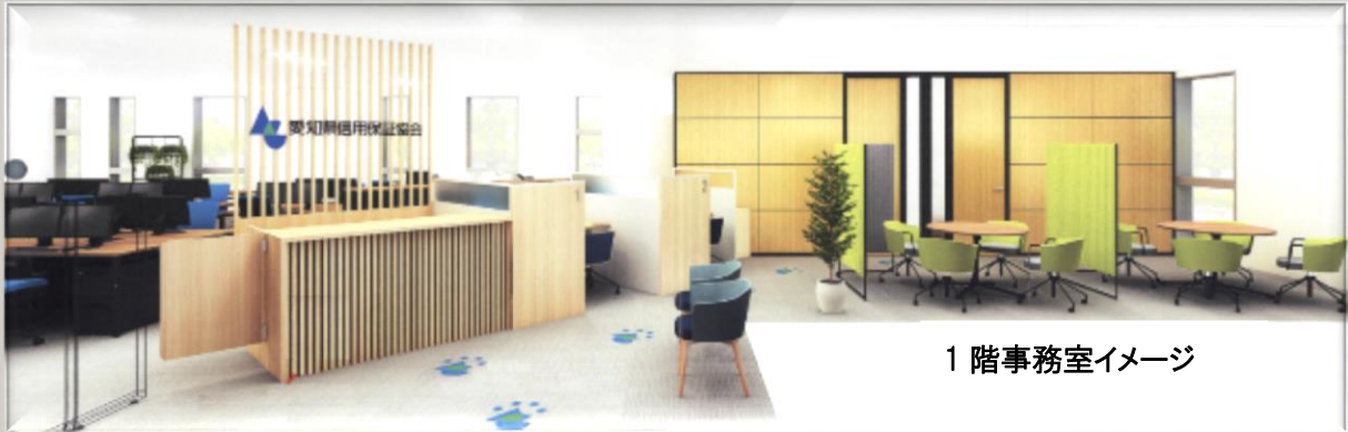
1階事務室イメージ